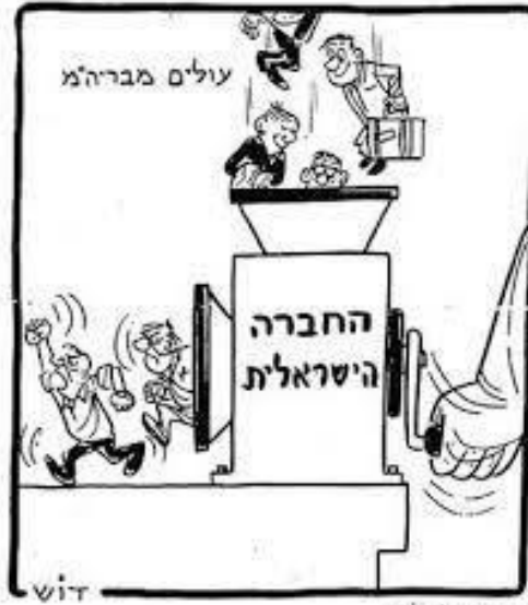
נספח ב' - מעריב 1.8.73